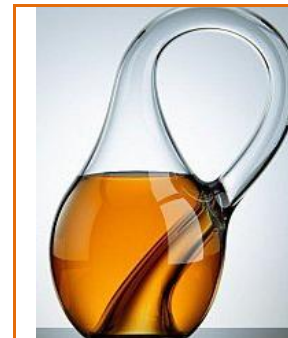
Objet impossible: la bouteille de Klein

Vous aurez beau faire Monsieur, dit la jolie marquise, vous n'aurez jamais mon cœur. – Je ne visais pas si haut, Madame – Faussement attribué à Molière Un lièvre accro aux réseaux sociaux prévient sa femme: - Pour ce soir, pense à mettre la robe, Hase . Bibliothèque: surface où l'on cherche le rayon pour trouver le volume . C'est à Laon que l'on peut faire fortune dans les bas de l'Aisne. Chinois qui appelle son épouse pour le repas: "Viens, mâchez riz !" Fille à sa Mamie: j'ai envoyé vingt tweets. – T'as envoyé vingt-huit quoi ? Il voulait une voiture de course pour sa retraite. C'est fait ! Il pousse le caddy. Est-ce qu'une voiture emportant des champignons dans son coffre est bien une voiture de spores ? À juger de ton bagage intellectuel, j'en déduis que tu aimes voyager léger ( faussement attribué à Lino Ventura ou d'autres ). Suite à un imprévu, le salon de la voyance est annulé .