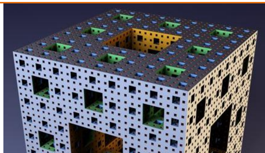
Objet fractal: le cube de Menger

C'est un SDF qui n'a pas de quoi se coucher. Le pauvre, il est dans de beaux draps ! Avec tous ces événements dans le monde, le passé simple devient un futur compliqué. Sur l'étang, notez que les pigeons roucoulent . Ce hibou s'est cassé la patte; hibouette ! Une poule qui parle verlan; toc, toc, toc . Prof de maths: - Tu as vu les abscisses ? – J'ai même pas vu les cinq premiers. Garçon, un café instantané, s'il vous plaît. – Désolé, je crains qu'il y ait un peu d'attente . Ce policier s'adresse à un sans-logis: - Nom et prénom ? – Bond, Vaga Bond ! C'est un facteur qui prenait des cours par correspondance . Alors que le veilleur de nuit travaillait ses cours du soir . Comment puis-je blâmer le vent pour le désordre qu'il a causé si c'est moi qui ai ouvert la fenêtre. Au bistrot: - Votre verre est vide, vous en voulez un autre ? Que voulez-vous que je fasse de deux verres vides ? Un cul-de-jatte est toujours à pied d'œuvre !