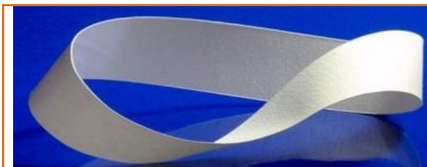
Ruban de Moebius

Vous croyez connaître l'anglais: Je veux être chirurgien: I want to be story . Promis chéri, je me coupe les ongles des orteils dès demain . Ah, bon! Ils sont si durs! Enchanté de vous rencontrer ! Vous êtes l'abbé Pamme ? – Non, il y a méprise, je suis Mousse. Abbé Mousse, pas Pamme . Une armoire à glace a mis au placard un type pas commode en lui collant une balle dans le buffet . C'est une phrase qui peut servir à meubler une conversation. Une truie se présente au commissariat: - Vous me dites que votre mari a accepté une invitation à un barbecue et depuis vous n'avez plus de nouvelles ... - C'est ça ! Un salon de thé. On y sert des infusions de thym. Un salon où l'on cause, un salon bar à thym . Le docteur a conseillé au capitaine Haddock, prenant de l'âge, d'installer des barres dans sa salle de bain. À voir toutes les bouteilles, on pense qu'il a mal compris ! Viellir, c'est comme escalader une grande montagne. En grim pant, les forces diminuent, mais le regard est plus libre, la vue plus large et plus sereine – Ingmar Bergman